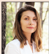
Мениджър „Корпоративни комуникации“

Времето е най-ценният ресурс, който има всеки от нас. Ежедневно ни се налага да правим избори дали да посветим няколко часа на любимите си хора, на хобито си, за почивка, за пътешествие... Да разпределим умело работа и личен живот, така че да се чувстваме удовлетворени, е истинско предизвикателство.