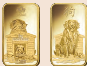
Златно кюлче „ГОДИНА НА КУЧЕТО“ е от 5 г с проба 999.9/1000.