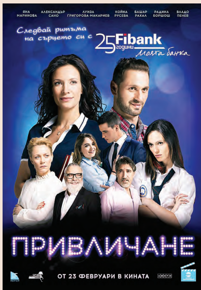
Постер от филма с актьорите и мотото „Следвай ритъма на сърцето си с Fibank“

Умела актьорска игра, много танци и хубава музика превръщат „Привличане“ във филм, който със сигурност ще завладее любителите на българското кино. За това говори и мотото: „Следвай ритъма на сърцето си“.