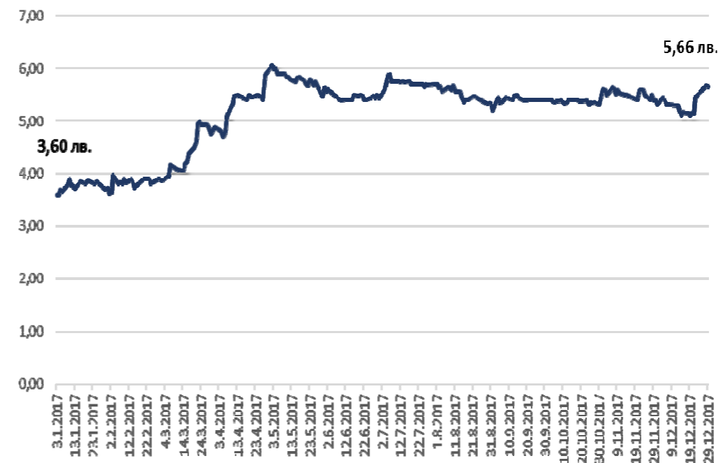
Изменение на цената на акцията на Първа инвестиционна банка АД през 2017 г.