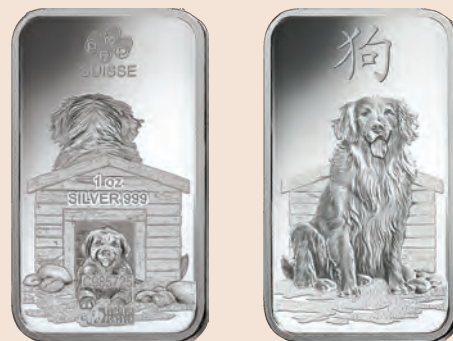
Сребърното кюлче „ГОДИНА НА КУЧЕТО“ е една тройунция с проба 999/1000.

И златните, и сребърните кюлчета са представени в стандартната сертификатна опаковка на швейцарската рафинерия ПАМП и в кутийка на Fibank. За първи път инвестиционно кюлче има декорация от двете страни, изображение на куче върху лицевата и върху обратната страна.