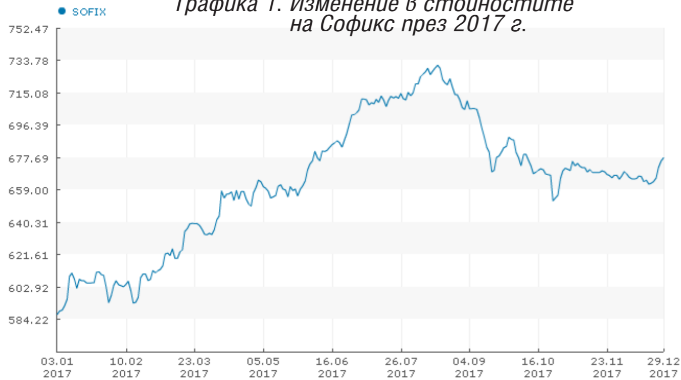
Графика 1. Изменение в стойностите на Софикс през 2017 г.