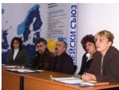
Проектът беше популяризиран чрез пресконференции и в местните медии, където бяха представени проблемите на децата, свързани с шансовете им на трудовия пазар.