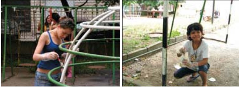
Акция преобядисване на катерушки и почистване на градинката на дома