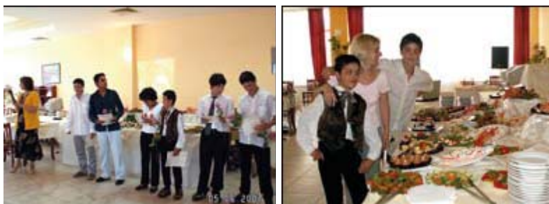
В края на проекта децата демонстрираха умения в организирано кулинарно шоу. То привлече интереса на работодатели, в резултат на което бяха наети на работа трима младежи.