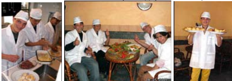
Практическо обучение „готвач“