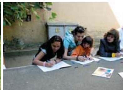
Доброволките помагат в обучението