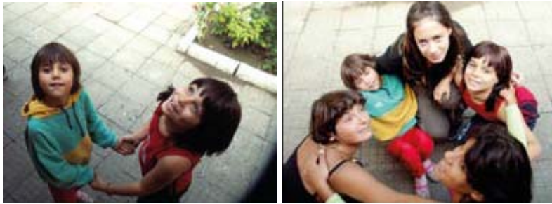
Ситуационни игри и фотосесии бяха част от тренинга на уменията за общуване на децата.